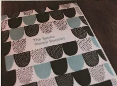
Japanilaiset saunaturistit keräävät löylyleimoja Visit Finlandin heille varta vasten suunnittelemiin pikkukirjoihin.