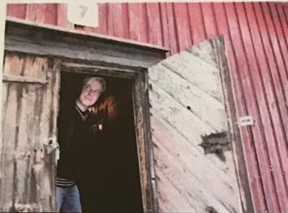
Krepelinin sauna valmistui vuonna 2012 hotellin pihapiiriin vanhaan, 1800-luvulla rakennettuun makasiinivarastoon.

Tunnelmallinen kristiinalaissauna pääsi mukaan Visit Finlandin Japaniin suuntautuvaan matkailukampanjaan.